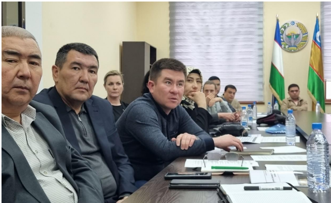
Фото 2: Участники круглого стола в г.Нукусе

Представители трех министерств из Ташкента, которые связаны с реализацией пилотного проекта, тоже высказали готовность к его поддержке и перспективах его масштабирования при условии успешных результатов.