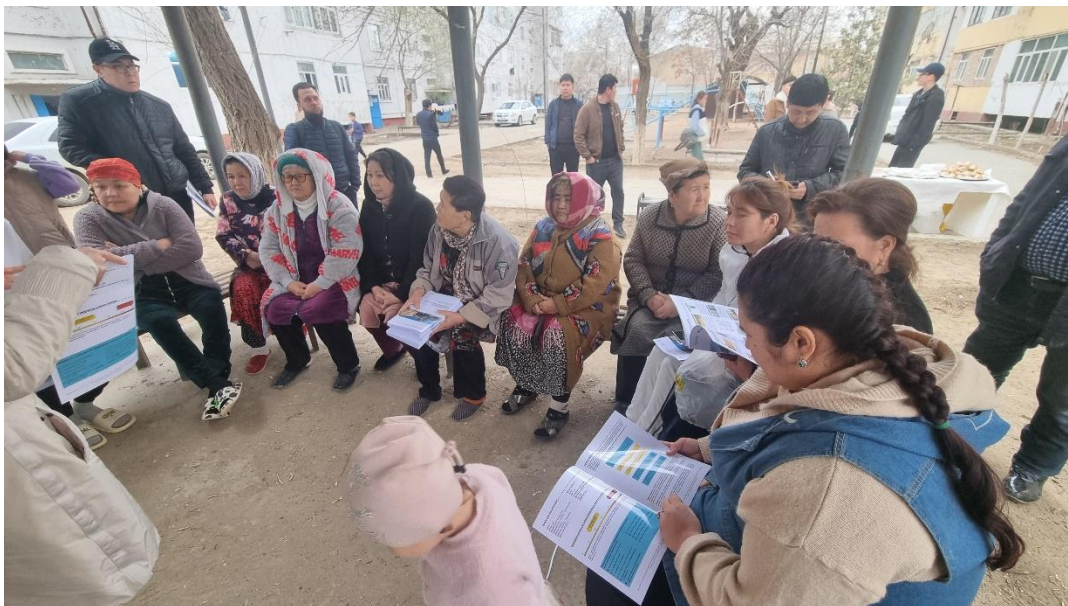
Фото 3: встреча с жильцами пилотного дома в Нукусе

открытый формат является важным аспектом к повышению доверия и осознанному участию жильцов в процессе модернизации.